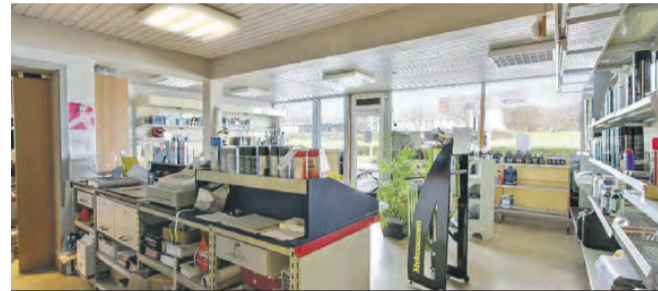
STRANDVEJEN 2 DANMARKS NOK FLOTTESTE BELIGGENDE TANKSTATION