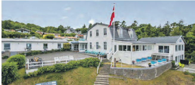
TEJNVEJ 52 ROMANTISK BADEHOTEL MED HAVUDSIGT