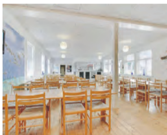
FÆLLEDEVEJ 28A VANDRERHJEM MED HAVUDSIGT - MULIGHED FOR OPFØRELSE AF HOTEL

Kontant: 2.000.000 Grund m 2 : 2.120 Erhverv m 2 : 394 Sag: 041-ERH-033