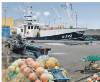
HAVNEVEJ 14, TEJN SKØN GRUND KUN ET STENKAST FRA ØSTERSØEN