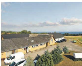
TUEVEJ 1, ØSTERMARIE SMUKT BELIGGENDE EJENDOM MED SELSKABSLOKALER OG 8 FERIELEJLIGHEDER