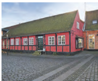
TORVET 26 SPÆNDENDE EJENDOM MED FORRETNING OG PRIVATBOLIG.